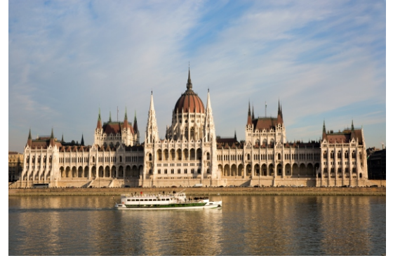
Budapest Parlament Ungarn