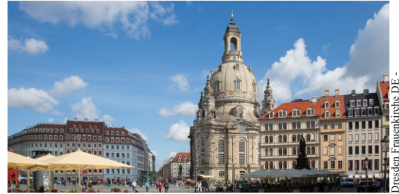
Dresden Frauenkirche DE