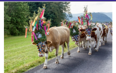
Almabtrieb, Kühe geschmückt

Detailinformationen und Kataloganforderung unter 07261/7375 Wir freuen uns auf Ihren Anruf!