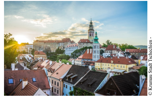
© Krumau Stadt Tschechien - Leonhard_Niederswimmer Pixabay

Achtung: Gültiger Reisepass bzw. gültiger Personalausweis erforderlich