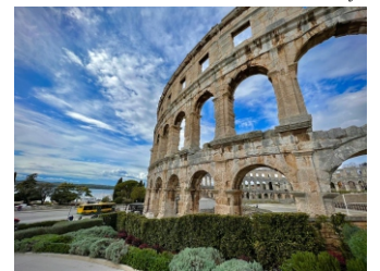
© Pula Kolozeum - James Qualtrough Unsplash