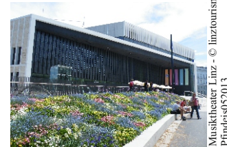
Musiktheater Linz