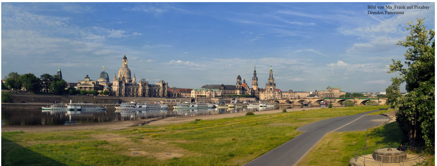
Dresden Panorama

2. Tag – 6. September: Frühstücksbuffet – Stadtbesichtigung in Dresden mit Reiseleitung ab Hotel – Stadtrundgang durch die historische Altstadt – vorbei am Theaterplatz mit der Semperoper und der katholischen Hofkirche, Zwinger, Taschenbergpalais, Residenzschloss, Brühlsche Terrasse und evangelische Frauenkirche – Rundfahrt vorbei am Altmarkt, Rathaus, Dynamo Stadion, Großer Garten und Gläserne VW-Manufaktur, Villenviertel über die Waldschlösserbrücke durch das Elbetal mit seinen Schlössern – Rundgang im Schlosspark Pillnitz – anschließend Rückfahrt ins Hotel, Abendessen und Nächtigung.