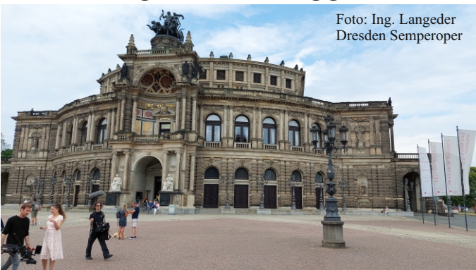
Dresden Semperoper

Hinweis: Bitte gerade bei mehrtägigen Reisen an eine Versicherung denken!