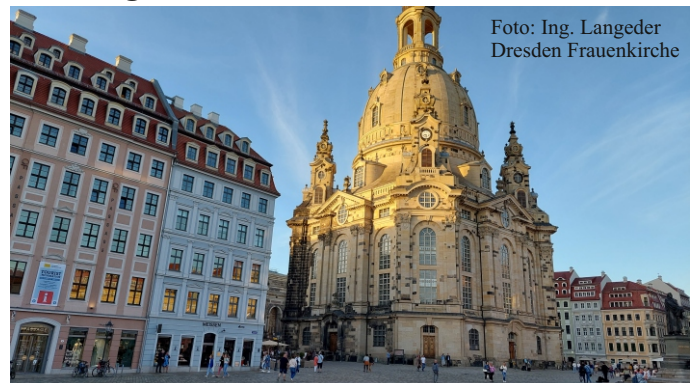
Dresden Frauenkirche